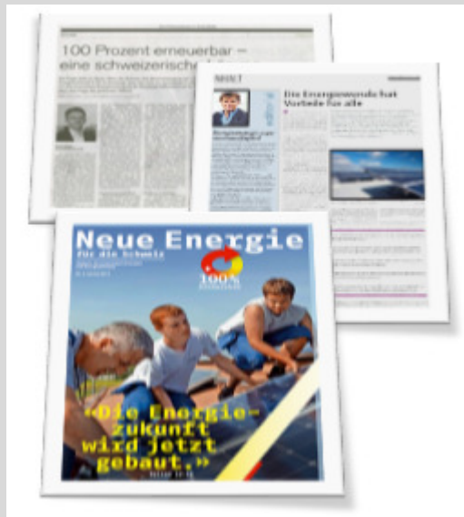
Artikel und Sonderbeilagen