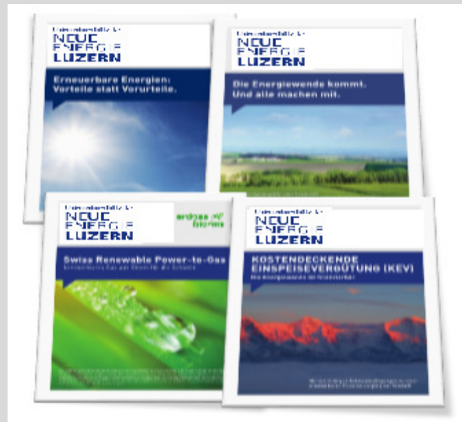
Fachpublikationen für Entscheidungs-träger und Multiplikatoren